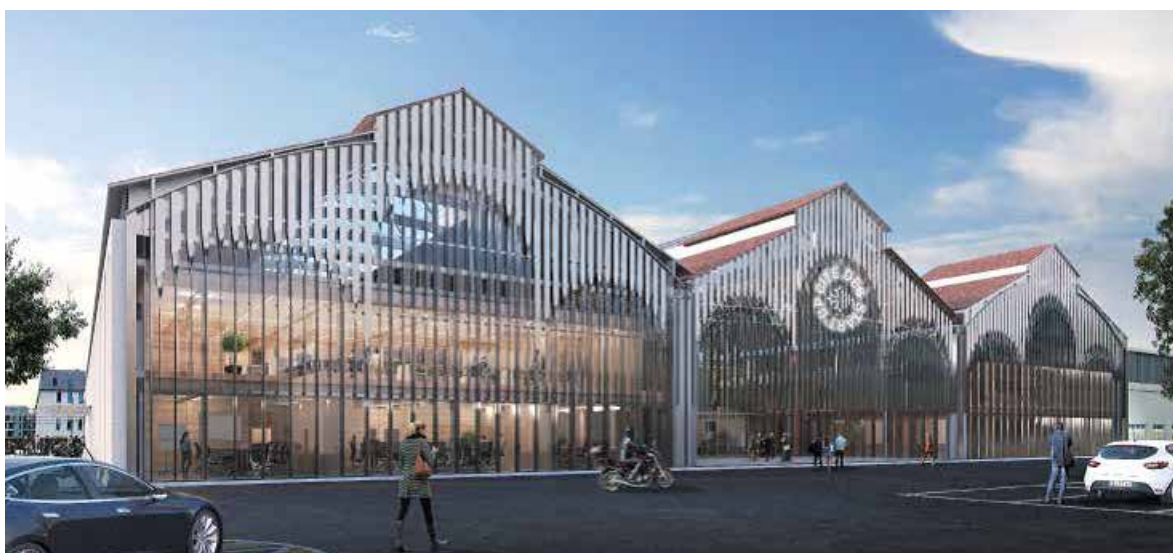
Cité des Start-up

La Région a manifesté son intention d'assurer la maîtrise d'ouvrage de la construction d'un espace dédié de 13 000 m 2 et d'en assurer le financement. La Région assurera ainsi la prise en charge des coûts de Gros Entretien et Renouvellement pendant 10 ans et accompagnera les programmes de recherche en mobilisant ses dispositifs d'intervention au titre du Schéma régional d'enseignement supérieur, de la recherche et de l'innovation.