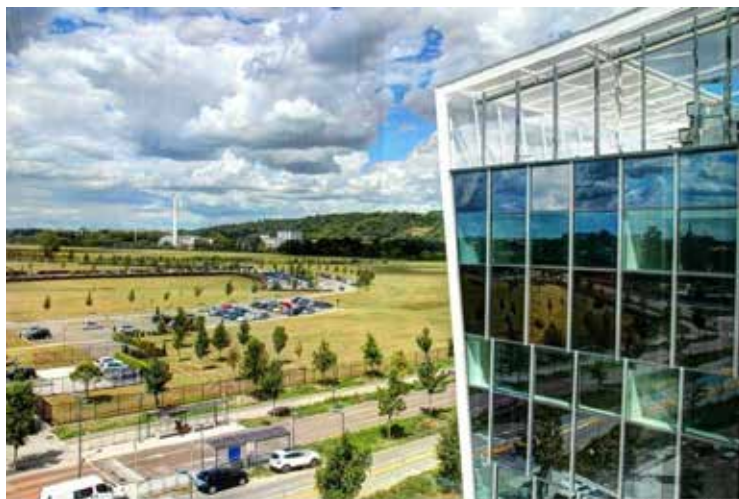
Le Centre de Recherche en Cancérologie de Toulouse sur le site de l'oncopole à Toulouse